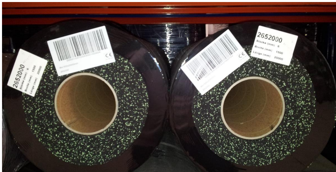
Obr. 4: Věnujte pozornost číslům šarže uvedeným na štítku