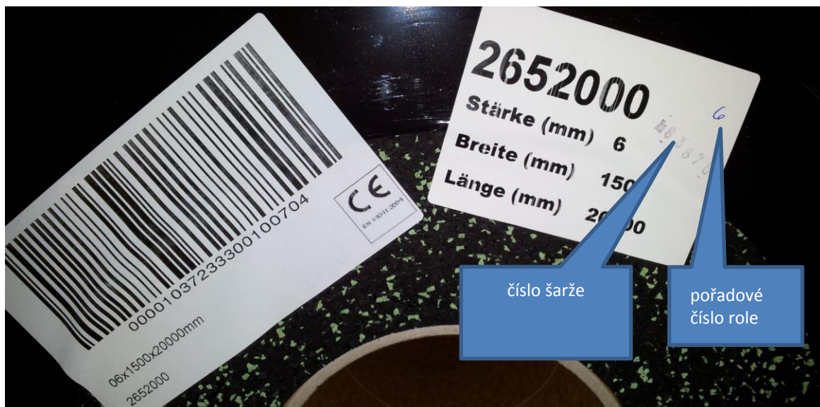
Obr. 5: Označení rolí a šarže

V případě špatné dodávky - poškozené zboží, nesprávné množství apod. oznamte pochybení okamžitě a zastavte pokládku. Nárok na výměnu zboží máte pouze v případě, že zboží není použité a udáte číslo šarže - viz.obr.5.