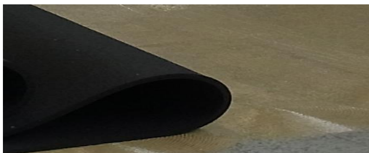
Obr. 2: Instalace podlahy SPORTEC®